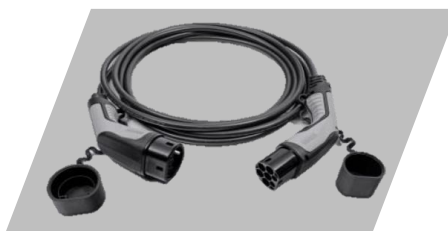
Kábel režimu 3, 6 m pripojenie do nabíjacej stanice (domácej alebo verejnej)

pripojenie do domácej zásuvky Číslo dielu: 9846744480 Cenníková cena: 420 €