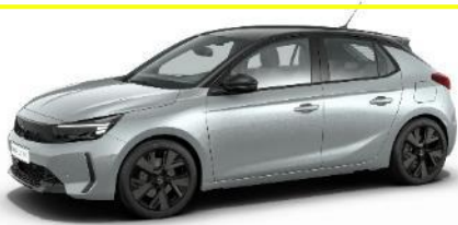
Strieborná Kristall (ZRMO) 0 €