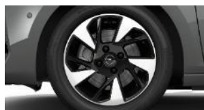
16" čierne disky z ľahkej zliatiny s výbrusom Diamond Cut (ZHU1)