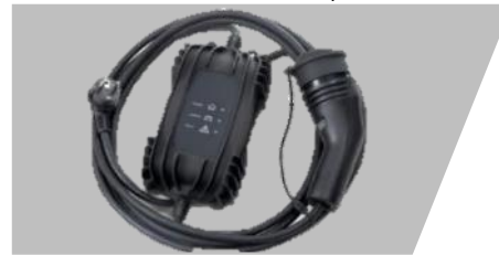
Kábel režimu 2 – typ EF, 1 fáza – 8 A – 6 m,

Pre pneumatiky: 205/45R17. Rozmery: 7Jx17 Číslo dielu: 1646346180 Cenníková cena: 241,45 €