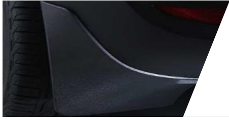
Lapače nečistôt (zásterky) predné/zadné

Číslo dielu: 1646164280/ 1646164180 Cenníková cena: 36,52 € / 36,46 €