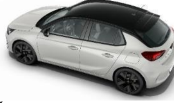
Čierna strecha Diamond Black (JD20) GS štandard