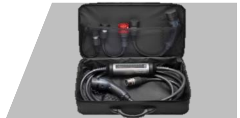
Kábel režimu 2 – Univerzálny, Súprava s nabíjacou jednotkou IC-CPD, max. 22 kW, konektor, typu 2 pre vozidlo a 3 adaptéry pre pripojenie k elektrickej sieti (Typ2+CEE16/ 3p+CEE7/7)

1 fáza-7,4 kW-32A-č.dielu: 9844681180 - 421 € 3 fázy-11 kW-3x16A-č.dielu: 9844681280 - 246 € 3 fázy-22 kW-3x32A-č.dielu: 9844681480 - 478 €