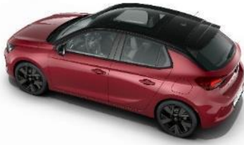
Presklenná strecha so slnečnou clonou (OK01) 800 €