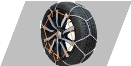
Snehové reťaze POLAIRE XP9 (veľ. 070) -2ks

Číslo dielu: 1642748780 Cenníková cena: 152,33 €