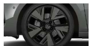
17" čierne disky z ľahkej zliatiny s výbrusom Diamond Cut (ZHQW)