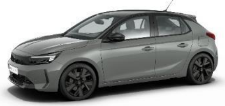
Šedá Grafik (SDM0) 500 €