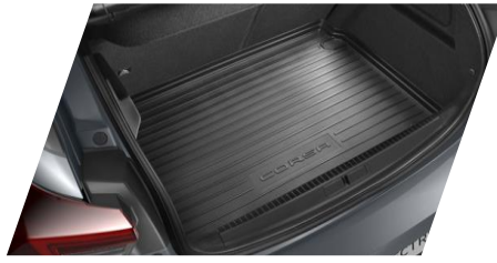
Gumová podložka do batožinového priestoru

Číslo dielu: 1646164280/ 1646164180 Cenníková cena: 36,52 € / 36,46 €