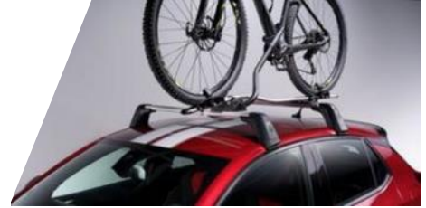
Strešný nosič bicykla Thule "Expert 298"

Rozmery: 1 330 x 860 x 370 mm. Objem: 320 l Číslo dielu: 93165509 Cenníková cena: 289,37 €