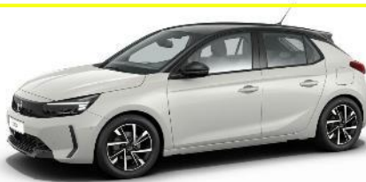
Biela Arktis (WPP0) 250 €