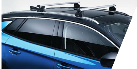
Základný nosič hliníkový Sada 2 tyčí.

Číslo dielu: 9833757280 Cenníková cena: 78,88 €