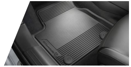
Celoročné podlahové rohože – čierne, 4ks

Číslo dielu: 1668247380 Cenníková cena: 101,51 €