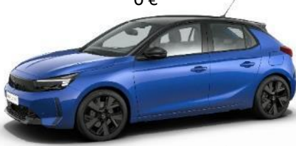
Modrá Voltaik (AVM0) 500 €