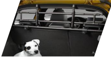
Univerzálna ochranná mreža pre psov, plast

9 mm snehová reťaz z odolnej ocele so zaskakovacím zámkom, 2 snehové reťaze, vhodné pre 185/65 R15 a 195/55 R16 Číslo dielu: 1623144780 Cenníková cena: 79,22 €