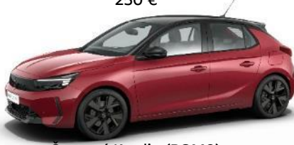
Červená Kardio (PQM0) 500 €