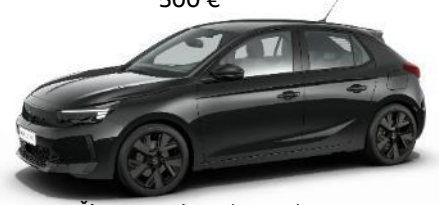
Čierna Karbon (9VM0) 500 €