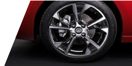
Disk z ľahkej zliatiny 17", 5 lúčov

Číslo dielu: 1613700380 Cenníková cena: 98,86 €