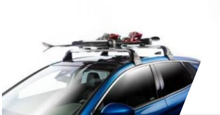
Nosič lyží/snowboardov Thule 7324, 4 páry lyží Číslo dielu: 9858802280 Cenníková cena: 323,62 € * v ponuke aj pre 6 párov