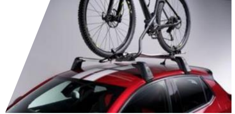
Strešný nosič bicykla Thule "Expert 298" Číslo dielu: 1642748780 Cenníková cena: 168,62 €