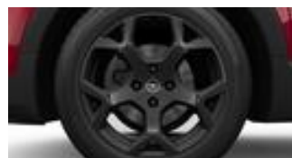
17" x 6,5J čierne disky z ľahkých zliatin so 4 dvojítmými lúčmi (ZHE5)