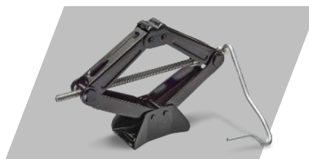
Súpravu náradia a zdvihák Číslo dielu: 1688296280 Cenníková cena: 50 €