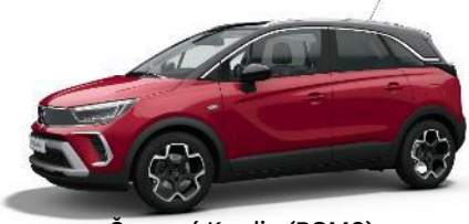
Červená Kardio (PQM0) 550 €