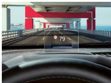
Head-up displej s dôležitými informáciami vždy na dohľad