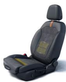
Ergonomické AGR sedadlá umožňujú vodičovi a spolujazdcovi cestovať uvoľnene aj na dlhých cestách.