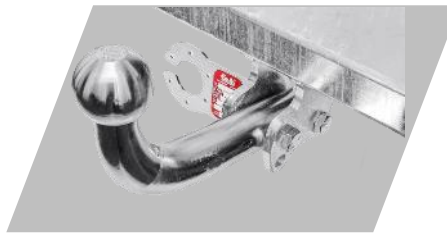
Ťažné zariadenie Galia Skrutkové prevedenie: 162€ Bajonetové prevedenie: 223,40 €