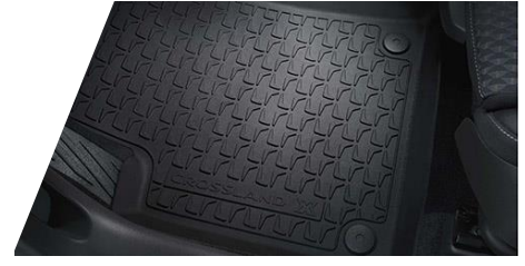
Celoročné podlahové rohože – čierne Číslo dielu: 13476012 Cenníková cena: 93,31 €