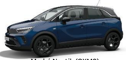
Modrá Nautik (QXM0) 550 €