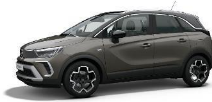
Šedá Vulkan (VLM0) 550 €