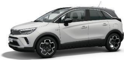
Biela Arktis (WPP0) 0 €