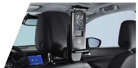
FlexConnect držiak tabletu (univerzálny) potrebne objednať FlexConnect adaptér Číslo dielu: 39092067 Cenníková cena: 231,23 €

Kompletnú ponuku príslušenstva nájdete na: OPEL PRÍSLUŠENSTVO