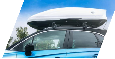
Strešný box Thule "Ocean 80," Rozmery: 1 330 x 860 x 370 mm. Objem: 320 l Číslo dielu: 93165509 Cenníková cena: 289,37 €