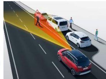
Automatické protikolízne brzdenie s detekciou chodcov