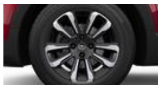
16" disky z ľahkých zliatin BiColor strieborno-čierny s 10 lúčmi (ZHE0)