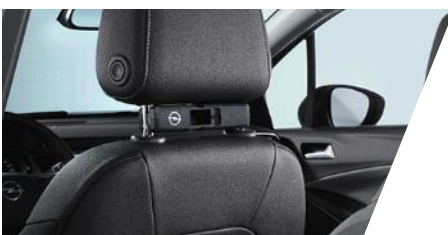
FlexConnect adaptér Číslo dielu: 13442005 Pôvodná cena: 59 €