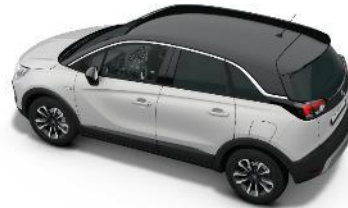
Čierna strecha Diamond Black (JD20) GS štandard / Elegance 500 €