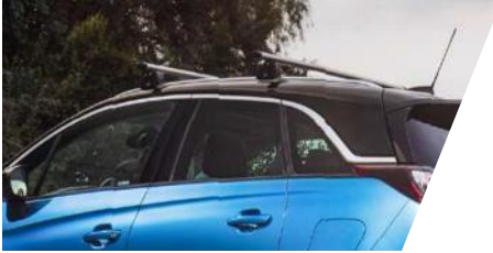
Základný nosič hliníkový Sada 2 tyčí. model so strešnými ližinami / bez strešných ližín Číslo dielu: 13474370 / 13474372 Cenníková cena: 342,23 € / 430,79 €