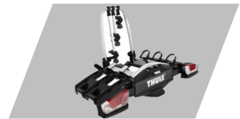
Nosič pre 3 bicykle na ťažné zariadenie "Coach 3 - 276" Číslo dielu: 9858801480 Cenníková cena: 1296,72 €