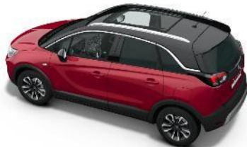
Pevná presklená strecha a strieborné strešné ližiny (OK01) 900 €