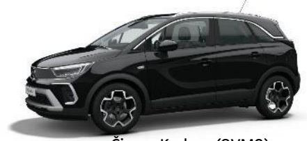
Čierna Karbon (9VM0) 550 €