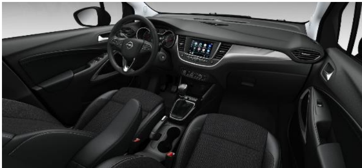
Čalúnenie kombináciou koža/látka Sparkle, čierne Jet Black, s ergonomickým sedadlom vodiča AGR (Elegance - Zimná sada Elegance - TUFX) 1100 €