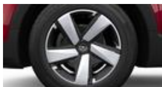
16" štruktúrované oceľové disky s strieborno-čiernymi krytmi (ZHD1)