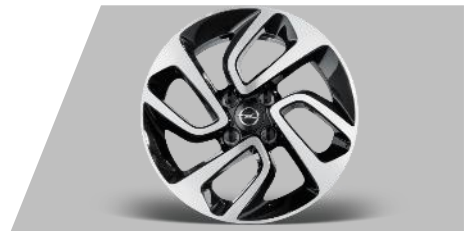
Disk z ľahkej zliatiny 16", 4 DVOJITÉ LÚČE Rozmery: 6,5Jx6 ET20, rozstup: 4x108 Pre pneumatiky: 205/60 R 16 92H Číslo dielu: 13469365 Cenníková cena: 194,98 €