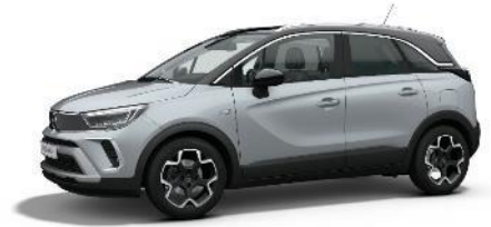
Šedá Kristall (ZRMO) 550 €