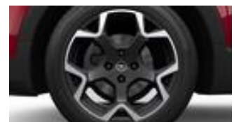
17" x 6,5J dvojfarebné disky z ľahkých zliatin so 4 dvojítmými lúčmi (ZHE3)