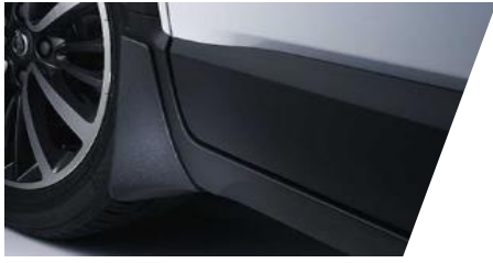
Lapače nečistôt (zásterky) predné/zadné Číslo dielu: 39096293/ 39096294 Cenníková cena: 52,54 € / 52,36 €