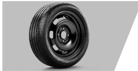
Plnohodnotné rezervné koleso 16" Súpravu náradia sa objednáva samostatne. Číslo dielu: 1677096680 Cenníková cena: 180 €