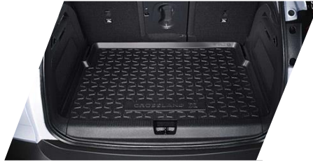
Gumová podložka do batožinového priestoru Číslo dielu: 39050915 Cenníková cena: 88,94 €