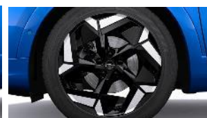
19" disky z ľahkých zliatin BiColor, dvojfarebné s výbrusom (ZHZR)