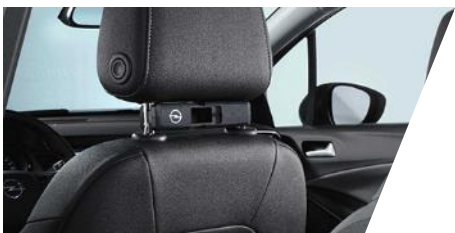
FlexConnect adaptér Číslo dielu: 13442005 Pôvodná cena: 59 €