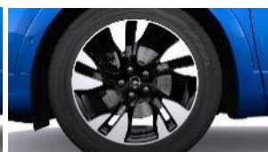
18" disky z ľahkých zliatin Diamond Cut s 5 dvojitými lúčmi, dvojfarebné s výbrusom (ZHLU)