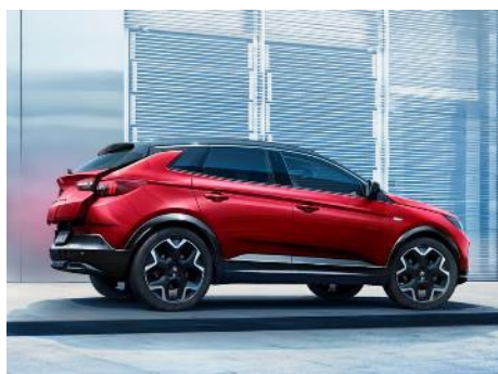
Bezklúčové otváranie piatich dverí

Zadné dvere ovládané senzormi bezdotykovo otvárajú a zatvárajú kufor