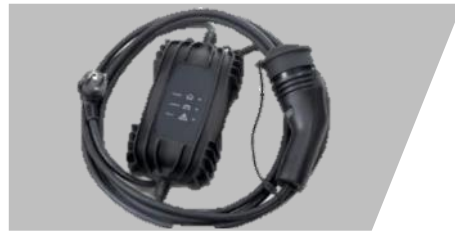
Kábel režimu 2 – typ EF, 1 fáza – 8 A – 6 m, pripojenie do domácej zásuvky Číslo dielu: 9846744480 Cenniková cena: 420 €