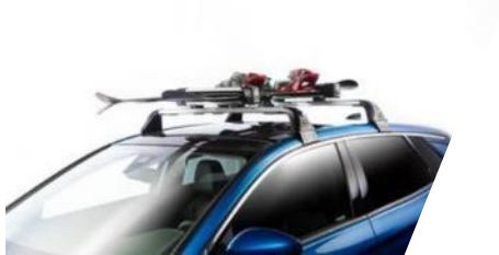
Nosič lyží/snowboardov Thule 7324, 4 páry lyží Číslo dielu: 9858802280 Cenniková cena: 323,62 € * v ponuke aj pre 6 párov