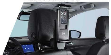
FlexConnect držiak tabletu (univerzálny) potrebne objednať FlexConnect adaptér Číslo dielu: 39092067 Cenniková cena: 231,23 €

Kompletnú ponuku príslušenstva nájdete na: OPEL PRÍSLUŠENSTVO