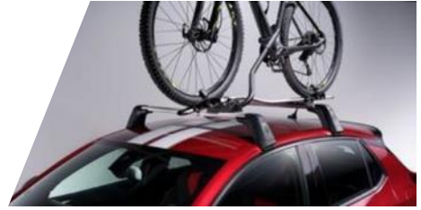
Strešný nosič bicykla Thule "Expert 298" Číslo dielu: 1642748780 Cenniková cena: 168,62 €