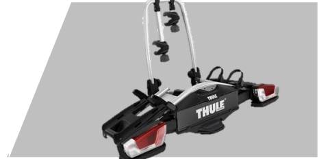
Nosič pre 2 bicykle na ťažné zariadenie Jednoduchá montáž bicyklov vďaka odnímateľným fixačným ramenám, nosnosť 46kg Číslo dielu: 1629425880 Cenniková cena: 715,58 €