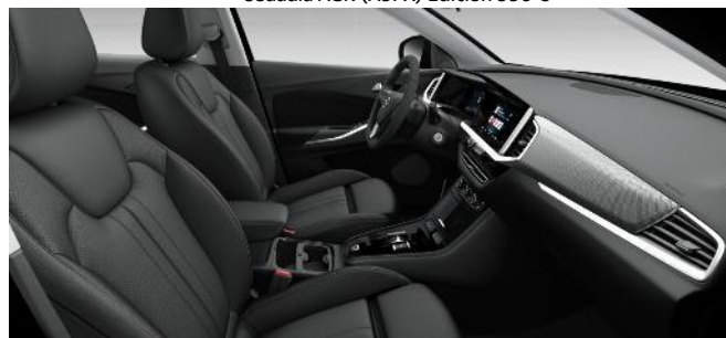
Kožené čalúnenie, čierne Jet Black, ergonomické vyhrievané a ventilované predné sedadlá AGR, elektricky nastaviteľné sedadlo vodiča v 8smeroch s pamäťou, vyhrievané zadné sedadlá (82FX) Edition 2500 €/Ultimate&GSe - 1300 €