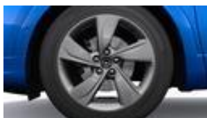
18" x 7,5J antracitové disky z ľahkých zliatin, celoročné pneumatiky (Mi28)