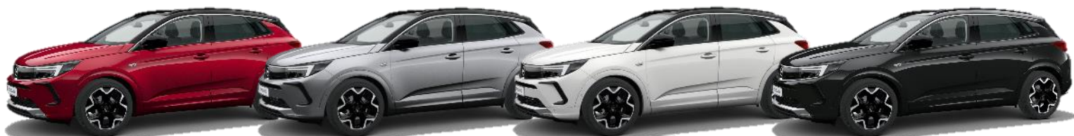
Červená Karmin (PQM0) 0 €