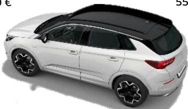
Čierna strecha Karbon Black a čierne strešné ližiny (KK01) - Sada Style / Ultimate&GSe štandard