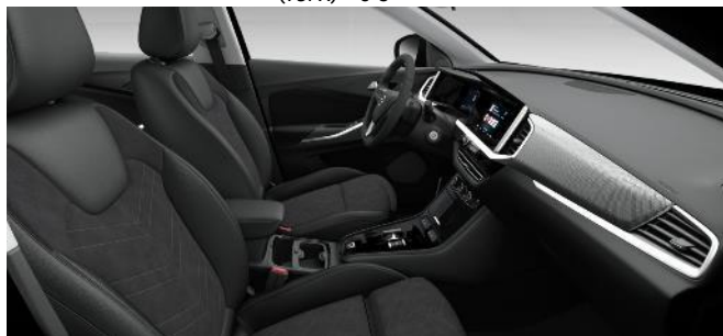
Čalúnenie Alcantara, čierne Jet Black, ergonomické vyhrievané predné sedadlá AGR (1UFX) Edition 1400 € / Ultimate - 0 €