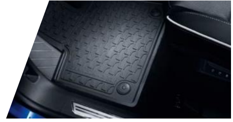
Súprava gumových tvarovaných kobercov kompletná súprava 4 odolných kobercov s nápisom Grandland vpredu na celoročné používanie s protišmykovým upevnením. Číslo dielu: 1680227180 Cenniková cena: 95,69 €