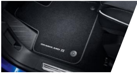
Súprava velúrových kobercov vpredu&vzadu Ochráni podlahu vášho nového Opel Grandland. Čierne so svetlosivým lemom a nápisom „Grandland“ vpredu. Číslo dielu: 1680227980 Cenniková cena: 115,33 €