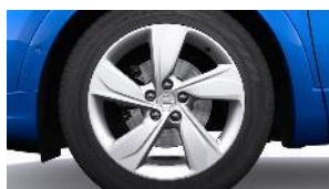
18" strieborné disky z ľahkých zliatin s 5 dvojitými lúčmi (ZHL0)