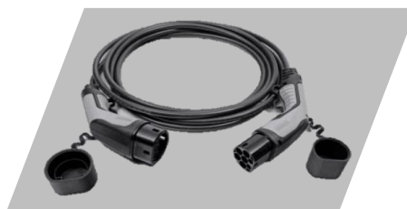
Kábel režimu 3, 6 m pripojenie do nabíjacej stanice (domácej alebo verejnej) 1 fáza-7,4 kW-32A-č.dielu: 9844681180 - 421 € 3 fázy-11 kW-3x16A-č.dielu: 9844681280 - 246 € 3 fázy-22 kW-3x32A-č.dielu: 9844681480 - 478 €