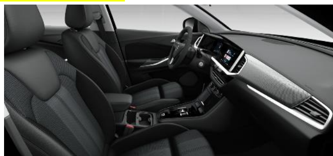
Látkové čalúnenie, čierne Jet Black, ergonomické vyhrievané predné sedadlá AGR (A9FX) Edition 990 €