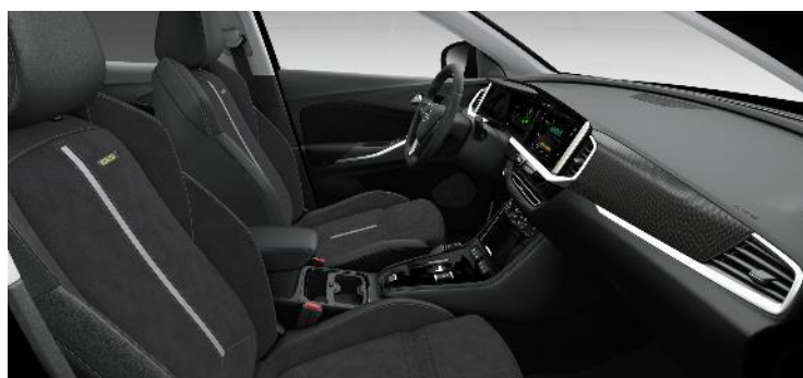
Čalúnenie Alcantara, čierne Jet Black, GSe Performance sedadlá - ergonomické vyhrievané predné sedadlá AGR (OJFX) GSe štandard