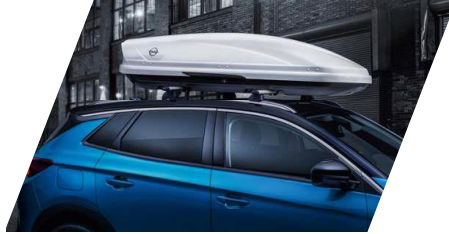
Strešný box Thule "Ocean 200," Elegantný strešný box praktického formátu. Rozmery: 175 x 82 x 45 cm. Objem: 390 l Číslo dielu: 1662444380 Cenniková cena: 620,00 €