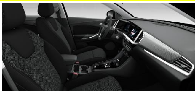
Látkové čalúnenie, čierne Jet Black, komfortné predné sedadlá (79FX) - 0 €