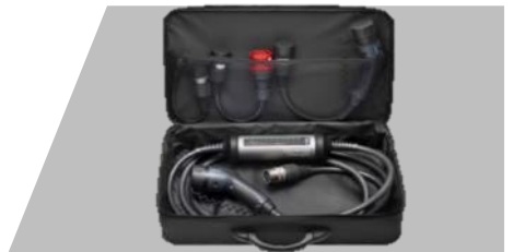
Kábel režimu 2 – Univerzálny, Súprava s nabíjacou jednotkou IC-CPD, max. 22 kW, konektor, typu 2 pre vozidlo a 3 adaptéry pre pripojenie k elektrickej sieti (Typ2+CEE16/ 3p+CEE7/7) Číslo dielu: 9846031380 Cenniková cena: 1 217 €