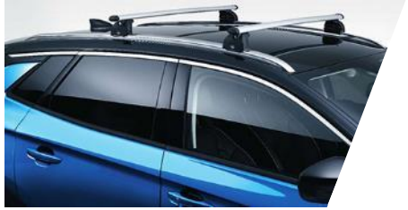
Priečne strešné hliníkové nosiče Sada 2 ks. zvyšujú nosnosť vozidla a uľahčujú prepravu veľkoobjemových nákladov. Nosnosť je 60 kg. Číslo dielu: 13474370 Cenniková cena: 342,23 €