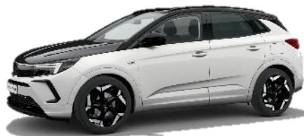
Čierna kapota Karbon Black (7N02) - 350 €