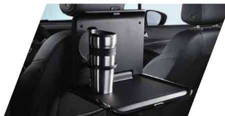
FlexConnect sklápny stolček potrebne objednať FlexConnect adaptér Číslo dielu: 13442006 Cenniková cena: 177,41 €