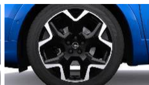
19" disky z ľahkých zliatin Diamond Cut, dvojfarebné s výbrusom (ZHVK)