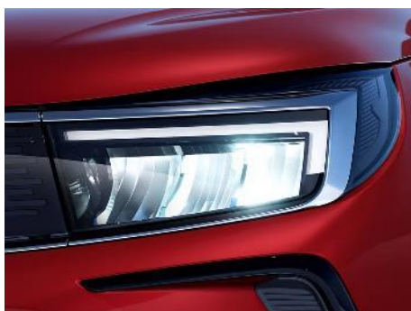
Intelli-Lux LED® pixelové svetlo

Zadné dvere ovládané senzormi bezdotykovo otvárajú a zatvárajú kufor