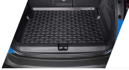
Vanička do batožinového priestoru s vyvýšenými okrajmi, umývateľná a prispôbena tvaru batožinového priestoru. s Nápisom Grandland. Číslo dielu: 1681894280 Cenniková cena: 108,55 €