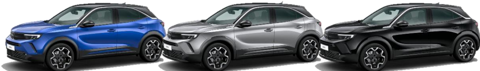
Modrá Voltaik (AVM0) 550 €