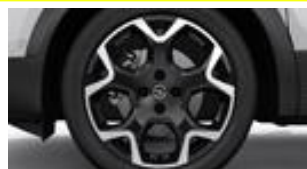
18" dvojfarebné disky z ľahkých zliatin s 5 lúčmi a červenými prvkami (ZHA3)