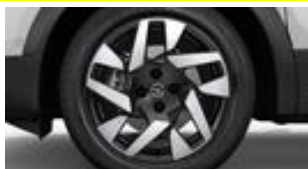
17" dvojfarebné disky z ľahkých zliatin s 5 dvojitými lúčmi (ZHP8/T9)