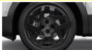
17" čierne disky z ľahkých zliatin s 5 dvojitými lúčmi (ZHP9)