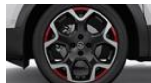
18" dvojfarebné disky z ľahkých zliatin s 5 lúčmi (ZHQ1)